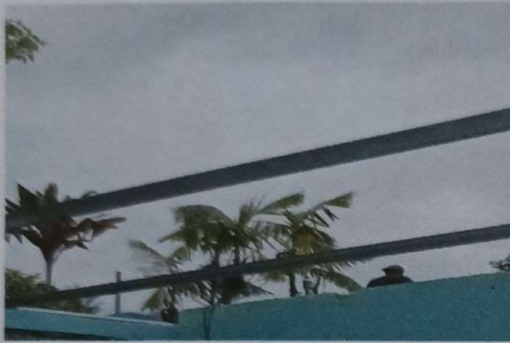
Foto 1. Mejoramiento de techo con estructura metalica tipo portico